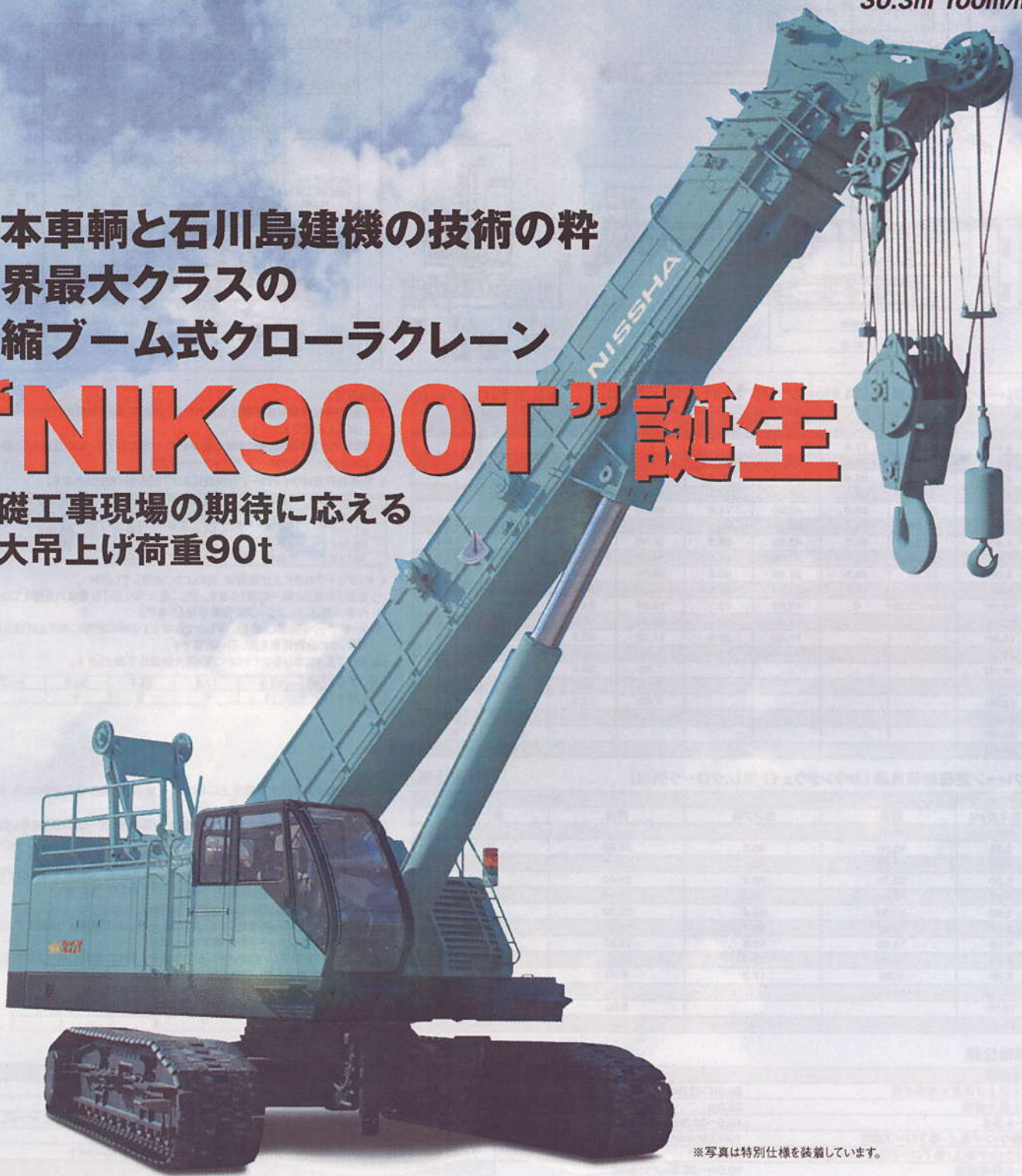
※写真は特別仕様を装着しています。